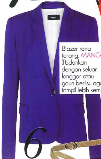
Blazer rona terang, MANGO (Padankan dengan seluar longgar atau gaun berlisu agar tampil lebih kemas)